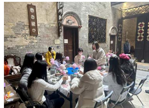
● 世遺景點舉行工作坊。