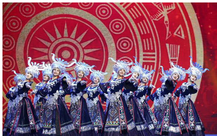
● 貴州歌舞團來澳賀歲。

將於學院禮堂舉辦《迎春音樂會 2025》，門票將於1月20日起，早上10時至下午7時在澳門演藝學院派發，中午正常辦公，派完即止，憑票免費入場；澳門中樂團將於2月8日在澳門文化中心綜合劇院帶來新春音樂會《草原狂想》；澳門樂團將於2月15日在威尼斯人劇場上演金沙中國表演藝術計劃呈獻《情約首爾》音樂會。