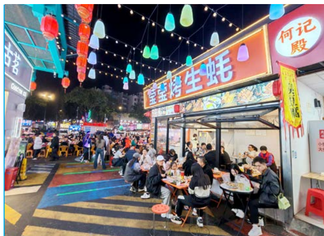
● 烤生蠔比當地飯店便宜。