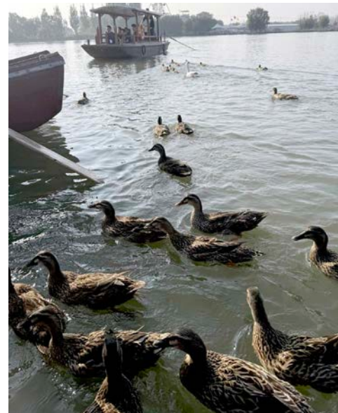
● 水鴨成群，美不勝收。