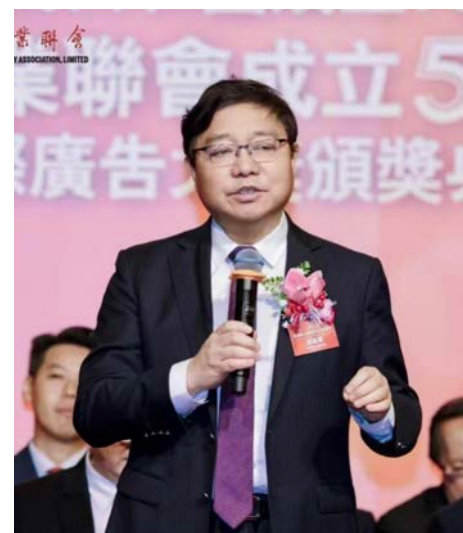
● 中國廣告協會會長張國華致辭

張會長稱：香港廣告業是中國廣告業乃至中國大陸一些產業的重要窗口，內地通過這個窗口融入世界。中國廣告協會與「聯會」一直有緊密聯繫。半個世紀以來聯會不斷發展，為香港繁榮穩定作出很大貢獻，歷任會長、主席功不可沒；現屆高麗娟會長投身聯會三十二年，歷任主席、會長的二十年間，對會務無償無私奉獻更令