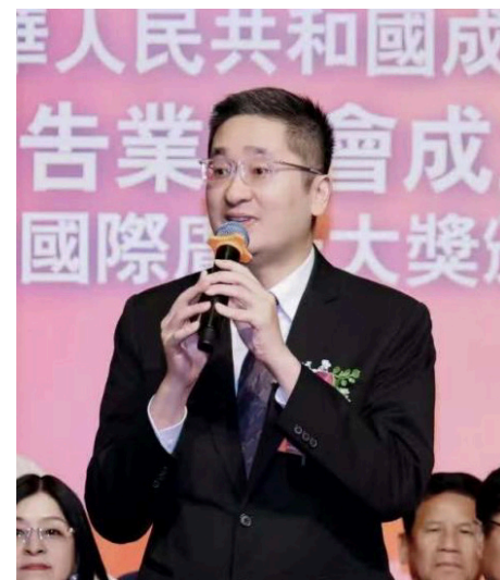
●香港商務及經濟發展局副局長陳百里先生致賀辭

香港廣告業聯會「慶祝中華人民共和國成立75週年暨香港廣告業聯會成立50週年及金紫荊國際廣告大獎頒獎典禮」，於2024年12月5日晚在西城大酒樓舉行。全國政協副主席梁振英先生向「聯會」致送賀函；香港政府商務及經濟發展局陳百里副局長、