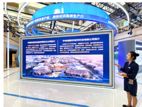
● 中電信等大型國企入住雄安，發展新質生產力。