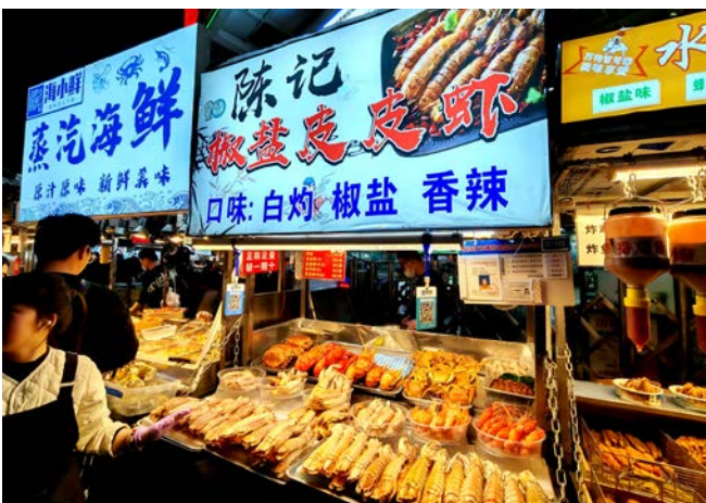
● 海鮮應有盡有以斤計價。

茗糖甜點是珠海糖水名店，提供的招牌有榴槤忘返、芒果雪中花涼粉、芒果粒粒爽、芒果糯米糍和糖不甩等，人均僅需10元。