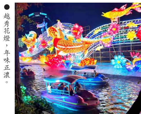
● 越秀花燈，年味正濃。