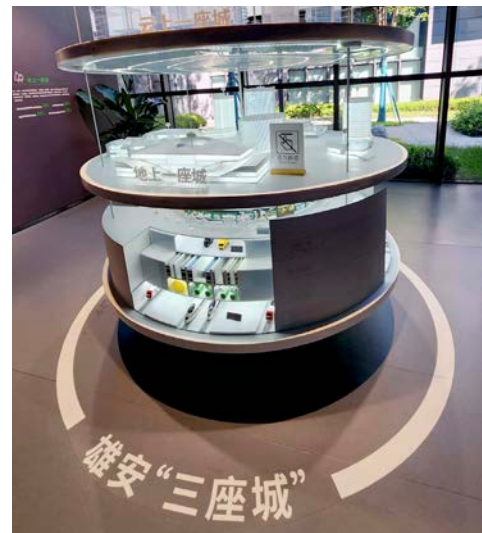
● 雄安「三座城」是其規劃的最大特色之一。