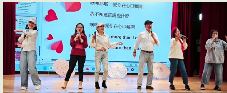
● 成人合唱組「愛你在心口難開」。