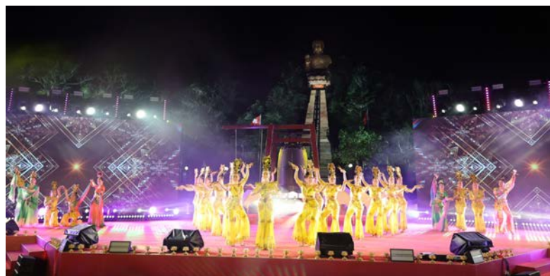
● 天壇大佛座下弘慈悲。