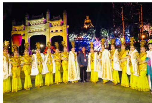
● 千手觀音頂禮大佛。