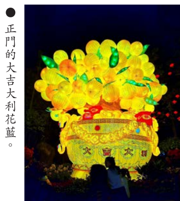
● 正門的大吉大利花籃。