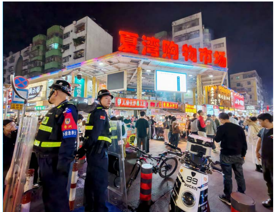
● 夏灣夜市有保安駐場。

主打足料潮汕美食，必食海鮮腸粉，有大量生蠔和蝦肉；潮州蠔烙，即點即炸，香口酥脆；椒鹽蝦鹹香惹味，伴啤酒一流；豬雜益母草湯潤肺解膩，整體食品價格都 ¥10-30 人仔。