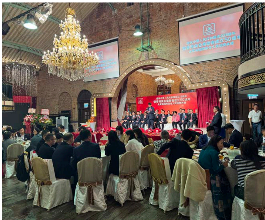
● 香港廣告業聯會「慶祝中華人民共和國成立75週年暨香港廣告業聯會成立50週年及金紫荊國際廣告大獎頒獎典禮」，於2024年12月5日晚在西港城大酒樓舉行。

中國廣告協會會長、國際廣告協會全球副主席張國華在「香港廣告業聯會」成立五十週年慶典上致詞，以「五十載風雨同舟，授業解惑真朋友。半世紀從弱到強，廣告品牌彰五洲。」概述內地與香港廣告業半世紀以來互相提攜發展歷程。他說：香港廣告業聯會成立於1974年，中國廣告協會則是在1983年成立，比香港晚了十年，港澳台特別是香港可以說是內地廣告業的啟蒙老師，經過半個世紀的互動交流，中國廣告業取得飛躍發展。中國廣告投入由1979年的1千萬元增至去年1.3萬億元，是當年的十萬倍。昔日，中國廣告品牌幾乎是零，2023年