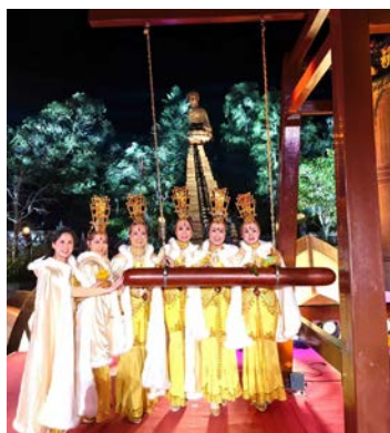
● 晨鐘響起，願眾生出離火坑。