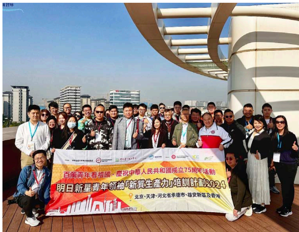
● 明匯智庫組織港青到雄安參觀考察。

「雄安」對於大多數港人來說，也許還是較為陌生。其實，對於內地人來說，它早在七年前，就已經成為耳熟能詳的響亮名字！