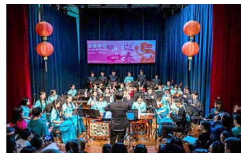
● 澳門中樂團新春音樂會。